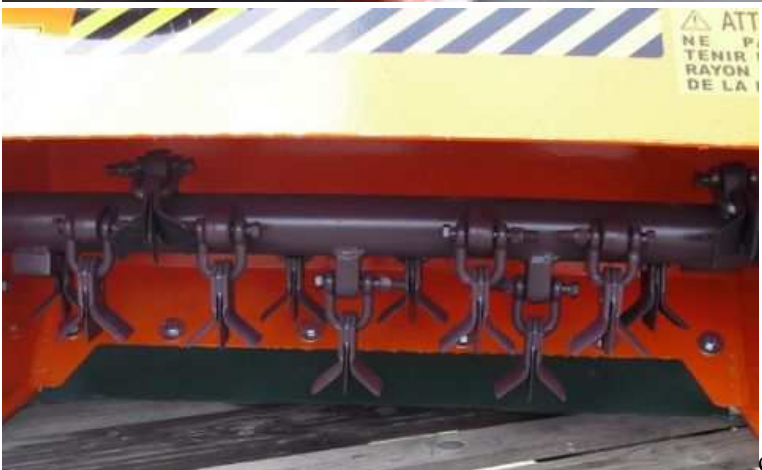
cou-teaux a (Y)