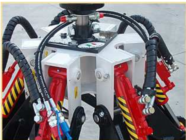
CYLINDRES HYDRAULIQUES PARTICULIERS POURVUS DE VANNE DE BLOCAGE