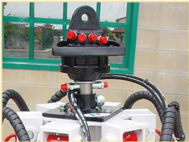
PARTICULIERE ATTACHE ROTATEUR