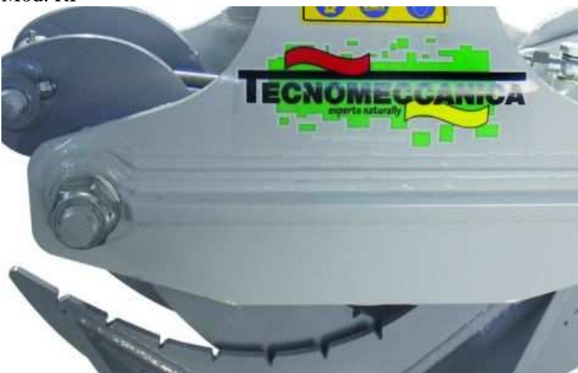
Grappin à pierres -bois-Mod. RP