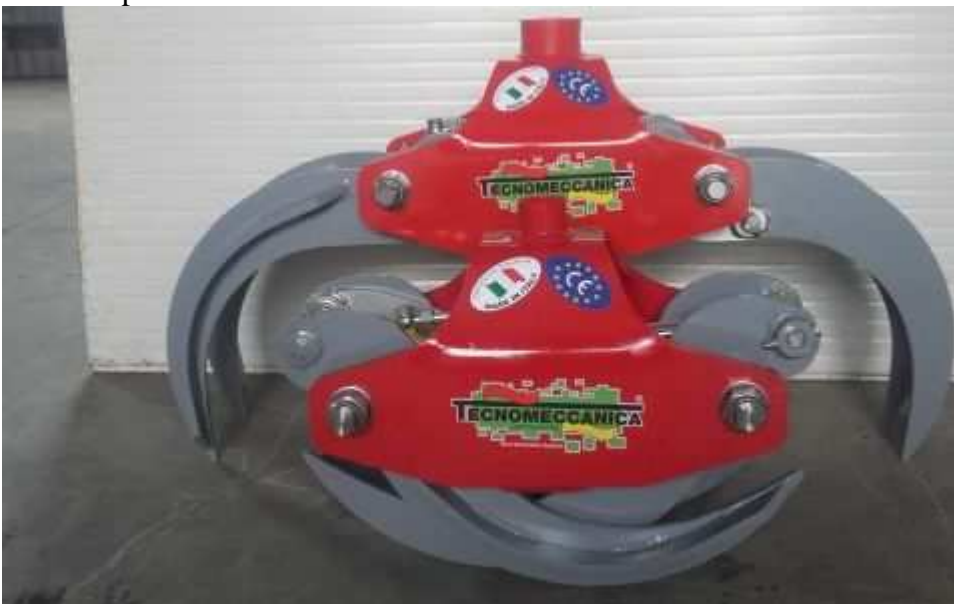
Grappin à bois -