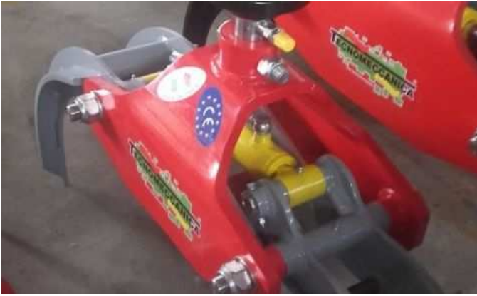
Grappin à bois - THLS30 professional

Grazie alla struttura centrale molto stretta ed ad uno spessore dell'acciaio molto elevato dove viene fissata