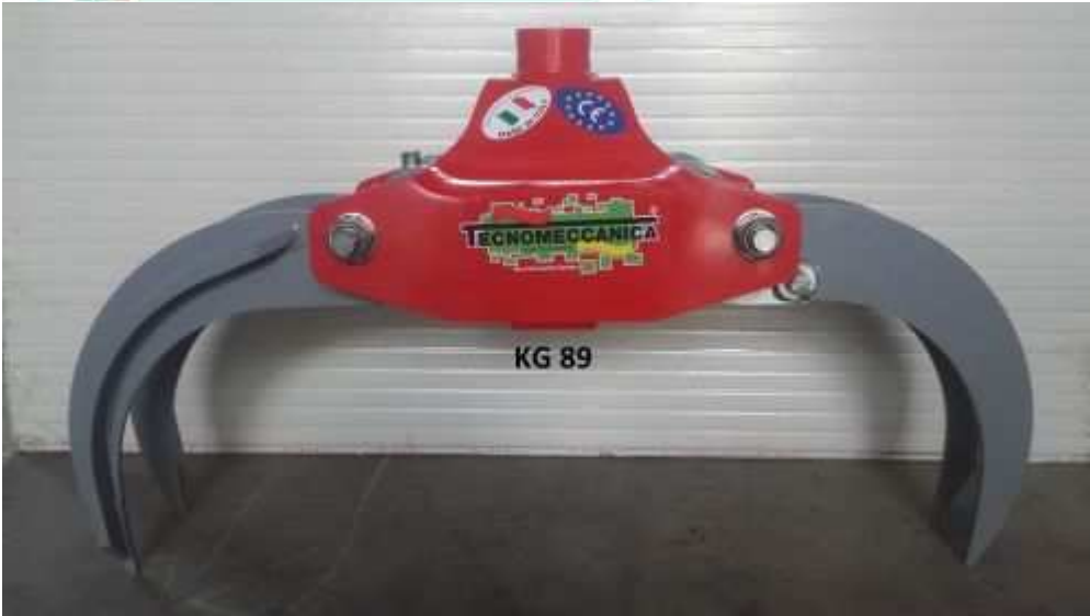
Grappin à bois -