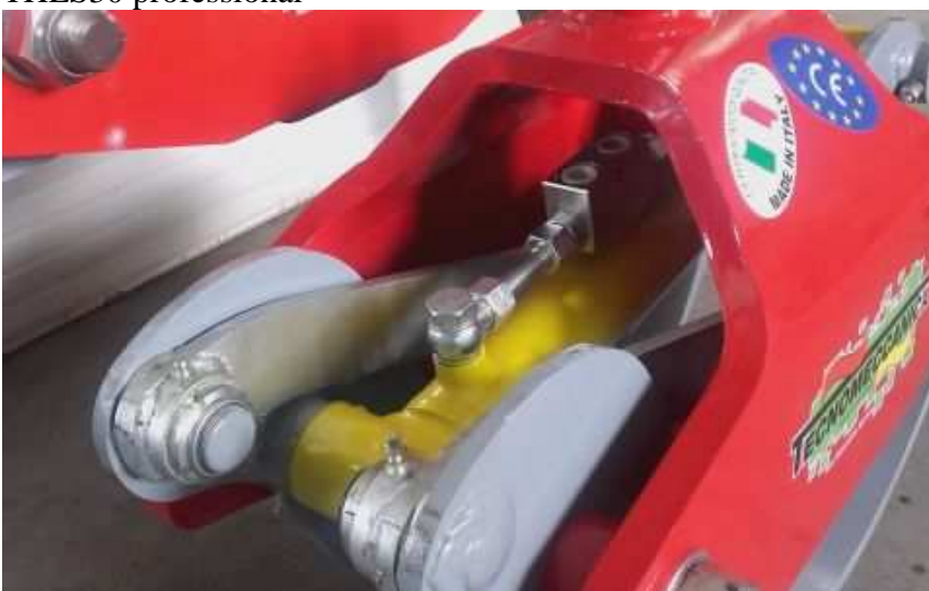
Grappin à bois -THLS30