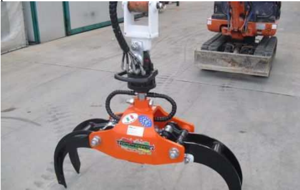
Grappin à bois -