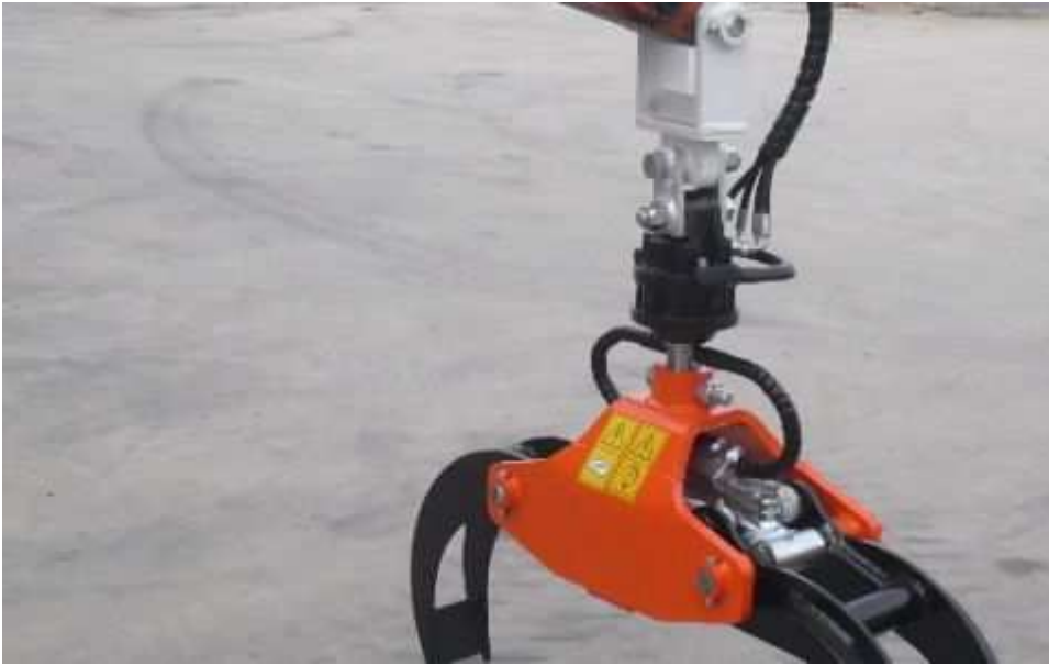
Grappin à bois -THLS30