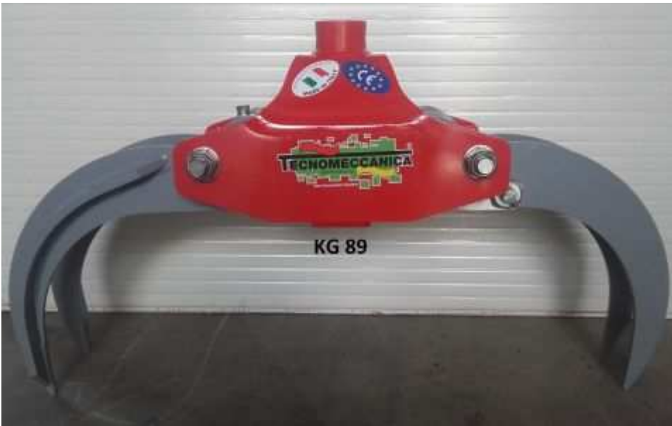
Grappin à bois -