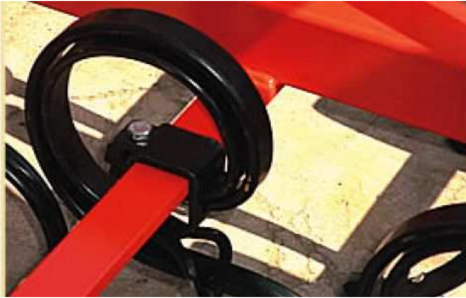
Ressort particulier 32x12