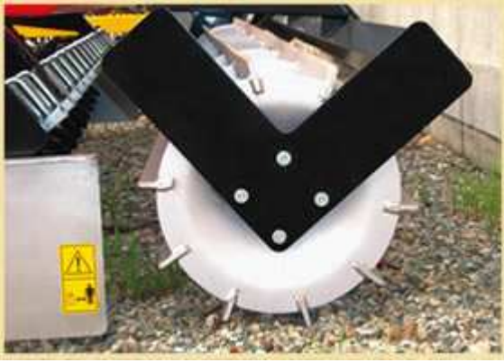
OPTIONAL: Rullo lamellare