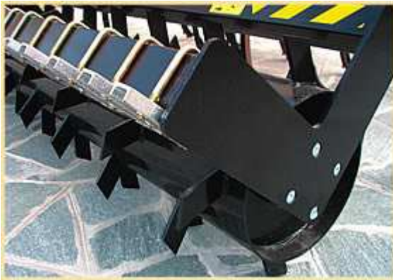
OPTIONAL: Rullo parker con raschietti regolabili