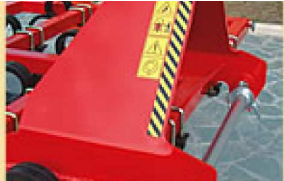
Fixation avec barre pour