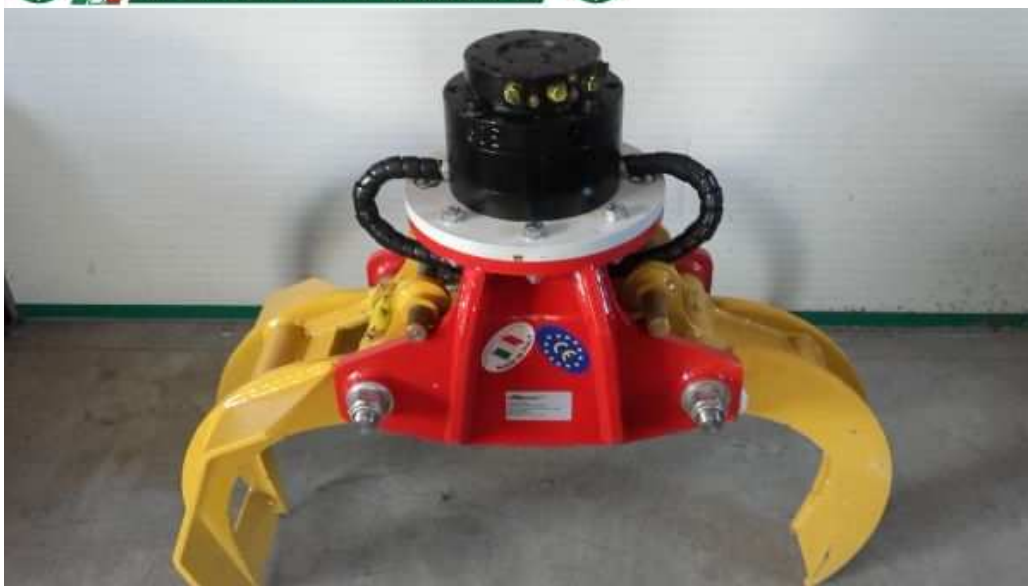
mod. TP100 RFP