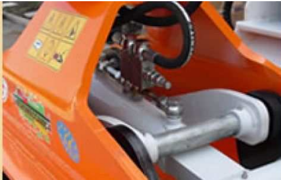
Con valvole di blocco e