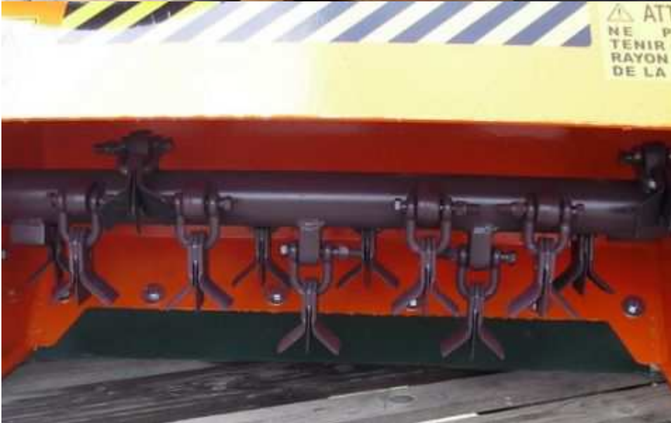
Coltelli a (Y)