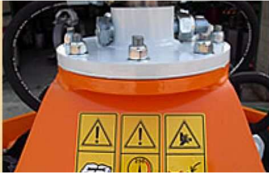
Sicherheitsperre Safety Block Tecnomeccanica