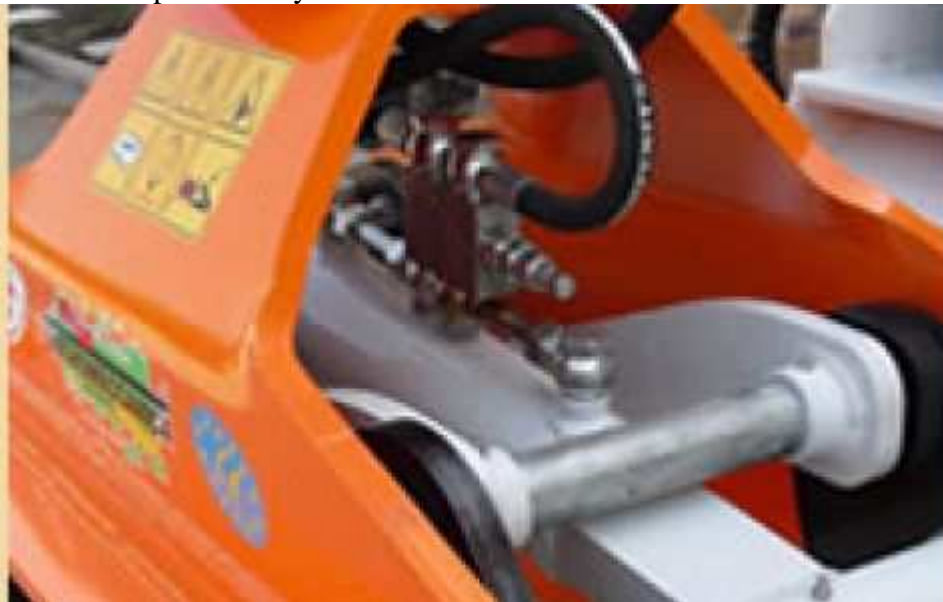
Sperrventil und einstellbarem Höchstdruck